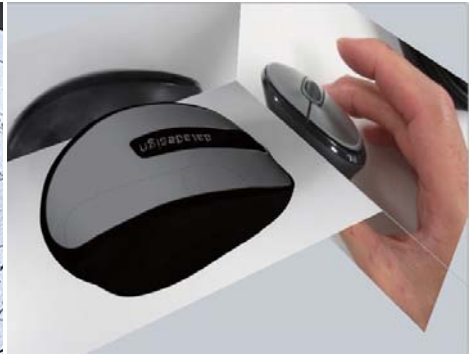
写真からのモデリング