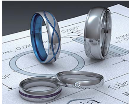
DXF/Illustratorからのモデリング