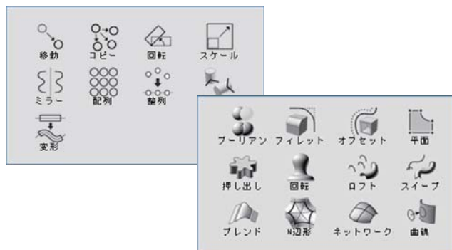
タブレット対応の直感的な操作メニュー